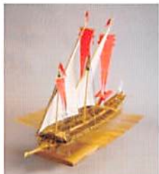
ガレー船 堀 健次