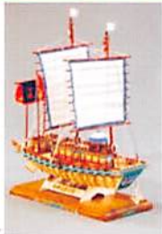
朝鮮通信使船 開田東洋志